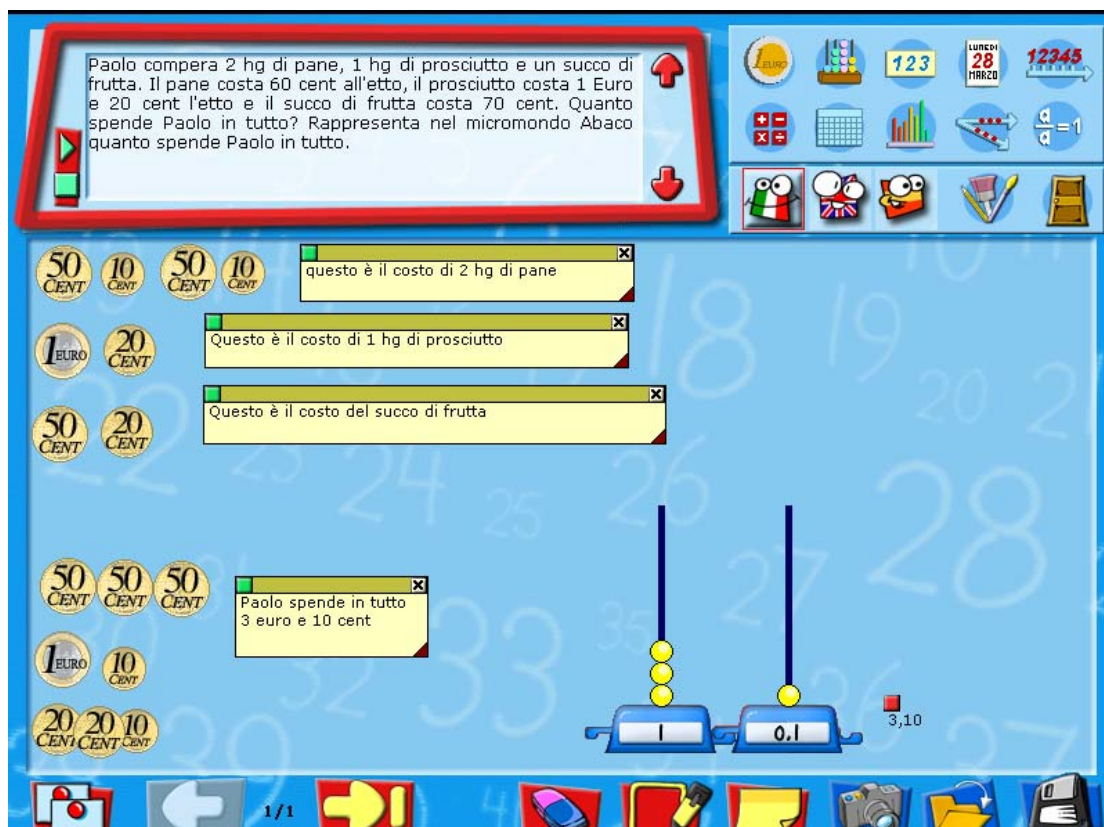
Figura 1: Interfaccia del foglio soluzione con un esempio di soluzione.

In questo ambiente l'utente può incollare rappresentazioni costruite nei micromondi (in questo caso in Euro e in Abaco), può inserire commenti per mezzo di "post-it", può aggiungere pagine, stampare la soluzione costruita, cancellare il lavoro fatto. Dal Foglio Soluzione si può accedere ai micromondi, selezionando le icone visualizzate in alto a destra. Il foglio soluzione, così come tutti gli altri strumenti di ARI@ITALES, è disponibile in tre lingue comunitarie: l'italiano, l'inglese e lo spagnolo.